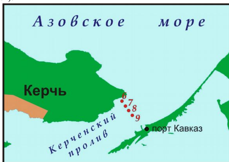
Рис. 3.2. Станции мониторинга в Северной узкости Керченского пролива в 2007 г.

Северная узкость (разрез п. Крым - п. Кавказ). В 2007 г. экспедиционные исследования в Северной узкости Керченского пролива проводилась морской гидрометеостанцией (МГС) «Опасное» на разрезе п. Крым - п. Кавказ с апреля по октябрь (рис. 3.2).